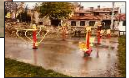
Abajo, parque biosaludable en Mangirón.