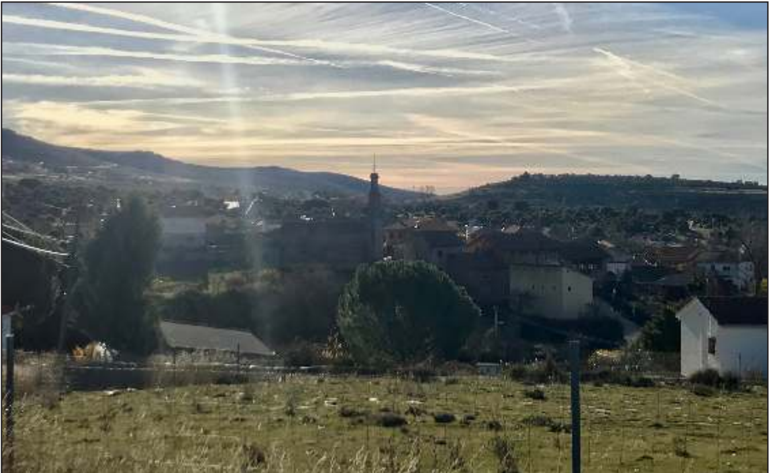
Serrada de la Fuente.