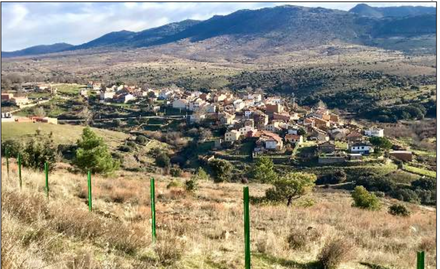
Paredes de Buitrago.