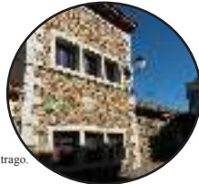
Centro Cultural de Paredes de Buitrago.