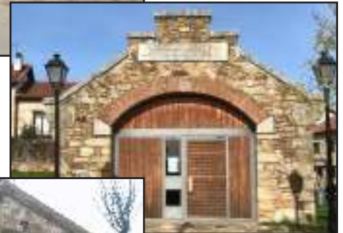
Museo de la Piedra.