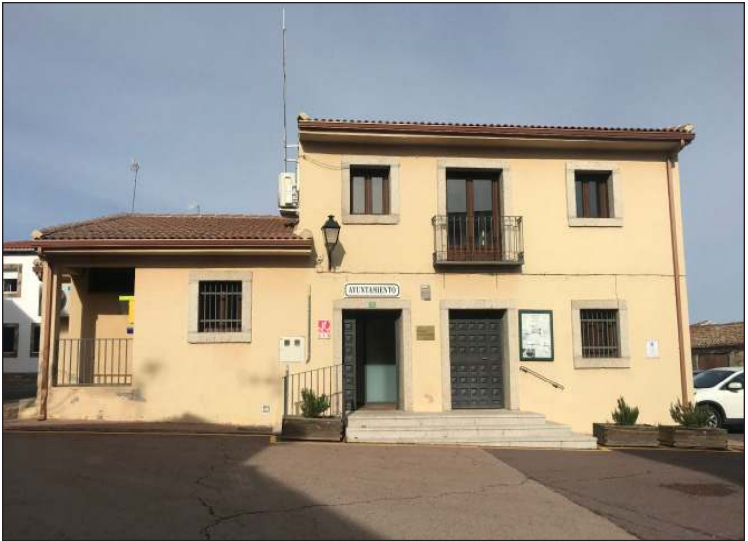
Edificio del Ayuntamiento de Puentes Viejas, en Mangirón.