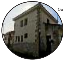
Centro Cultural de Mangirón.