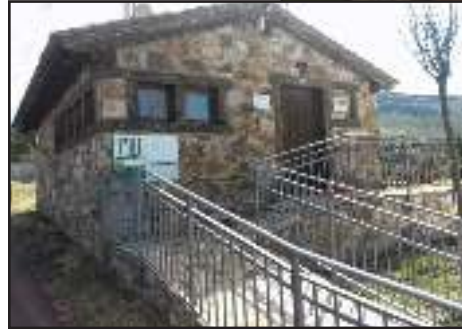
Museo de los Juegos Tradicionales.