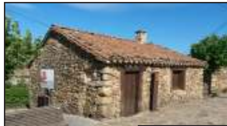
Museo de la Fragua.

• Museo y Parque de Juegos Tradicionales: Ubicado en Serrada en la Calle Eras, 7, podemos admirar diferentes réplicas de juegos castellanos tradicionales, como la Herradura o la Petanca, entre otros.