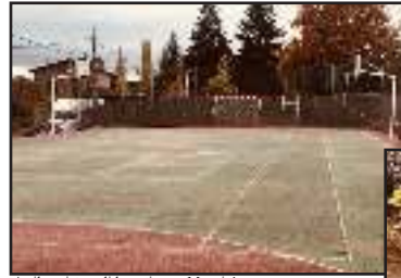
Arriba, pista polideportiva en Mangirón.